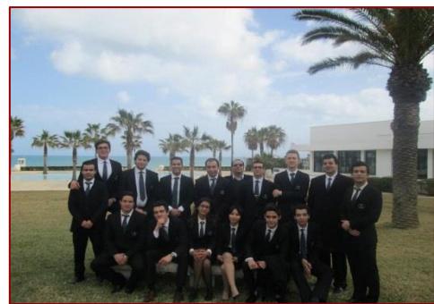
Visites d'entreprises pour les écoles de formation touristiques comme « VATEL », « Collège La Salle » et « IHEC »