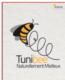
Parrainage des ruches d'abeilles pour la préservation de la biodiversité locale