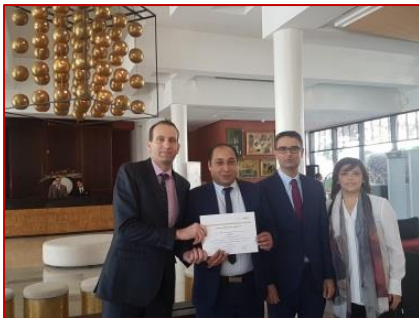
Récompense du Meilleur Employé 2017 par un séjour d'une semaine en Suisse