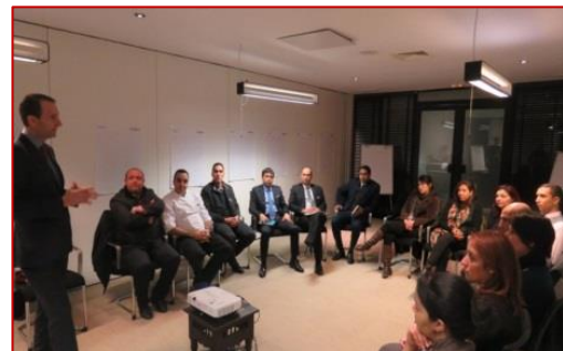
Lancement par le GM du cursus Midle Management Program