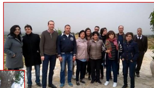
Outing & Teambuilding du HOD