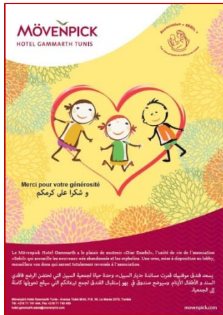
Parrainage de l'association « Sebil » Et de l'unité de vie « Diar Essebil »