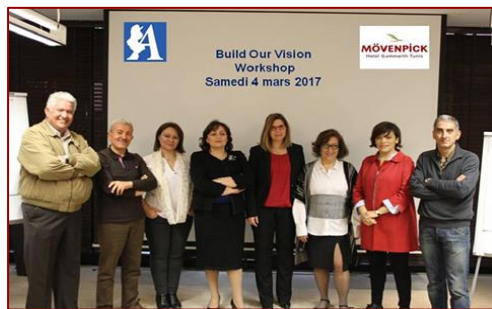
Accueil du « café RH » et des ateliers de partages des bonnes pratiques de l'ARFORGHE