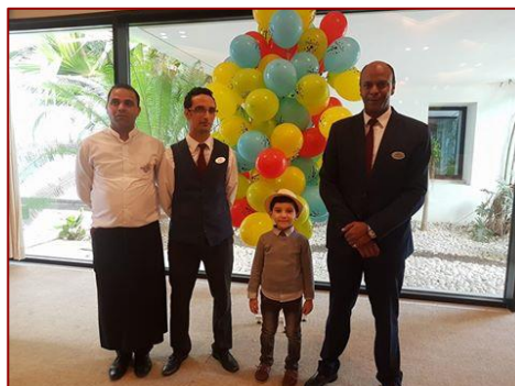
Une journée animée, clown et jeux divers avec un mini-brunch pour les enfants de l'association « OMNYATI »

Aussi, dans le cadre de la sauvegarde des abeilles en Tunisie, nous nous sommes engagés à parrainer des ruches d'abeilles via l'association « Tunibee » afin de préserver la biodiversité locale, promouvoir l'agriculture biologique et aider des apiculteurs nécessiteux. Cette action procurera un nombre de pots de miel « Bio » par an qui seront offert à nos clients au sein de l'hôtel.