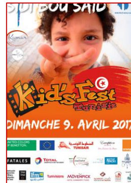
Sponsoring et participation A la manifestation locale « Kid's fest »