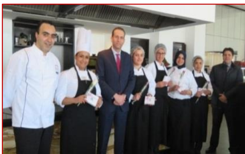
Des roses à l'occasion de la Journée Internationale de la Femme