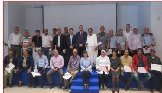
Farwell Party pour les départs en CCL