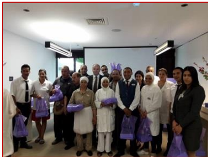
A l'occasion de l'Aid El Fitr 2017, des pâtisseries tunisiennes ont été offerte aux employés